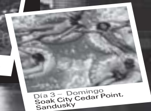
Día 3 - Domingo Soak City Cedar Point, Sandusky

BUY THIS SPACE! La Prensa 313- 729-4435 Visit us at www.laprensa1.com