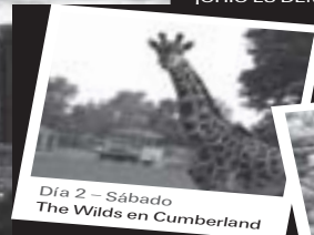
Día 2 - Sábado The Wilds en Cumberland