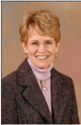
Dr. Mary Sue Coleman, University of Michigan

La disminución es especialmente inquietante porque los afro americanos y latinos, que en la actualidad constituyen un 45 por ciento de los graduados de las Escuelas Secundarias de California. Las